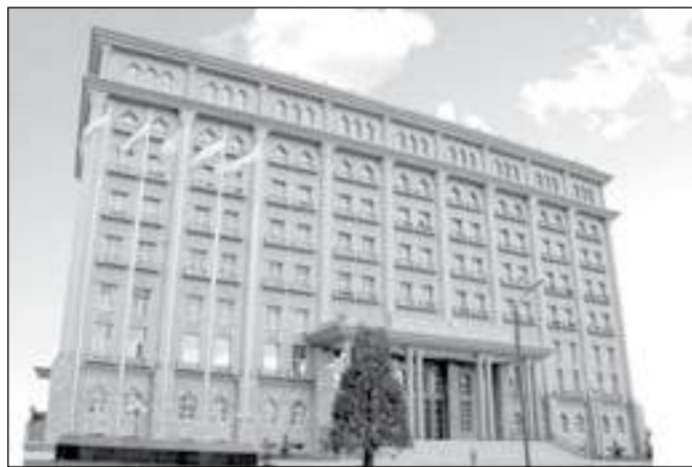
Таджикистан и Республикой Молдова и отвечает взаимным интересам сторон.

Министерство иностранных дел Республики Таджикистан подчеркивает, что сохранение безвизового режима соответствует духу дружественных отношений между Республи-