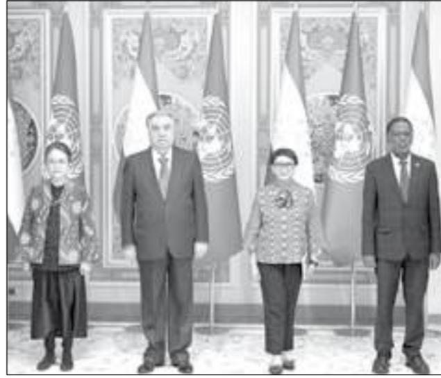
том ООН была, в частности, выражена уверенность, что расширение научно-практических связей таджикских учёных, исследователей и экспертов с этим авторитетным учреждением принесёт значимые результаты.

В ходе обсуждения вопросов сотрудничества с Университе-